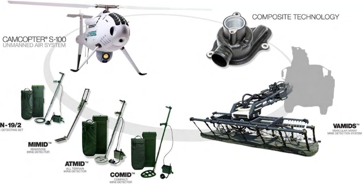
CAMCOPTER® S-100 UNMANNED AIR SYSTEM