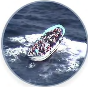
Search and Rescue